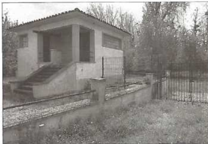
La station de pompage de Port-Boutiers, inaugurée en 1958 par René Renaud, maire, n'a cessé de puiser depuis lors des quantités croissantes de nitrates dans la nappe alluviale de la Charente.