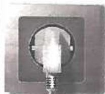
Variation du prix de l'électricité à usage domestique (en %) entre le 2 e semestre 2013 et le 2 e semestre 2014