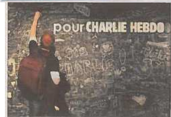
Au musée de la BD, les visiteurs s'expriment sur le mur Charlie.