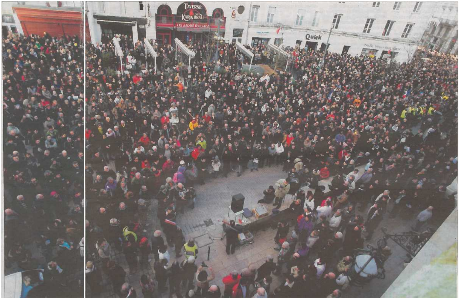
Le 11 janvier, plus de 30 000 Charentais rassemblent pour « Charlie Hebdo ». A Angoulême, la manifestation, qui va de l'hôtel de ville aux chais Magells, est impressionnante.

■ Il fallait répondre : 1 b ; 2 a ; 3 a ; 4 c ; 5 a ; 6 c ; 7 b ; 8 a ; 9 b ; 10 a ; 11 c ; 12 a ; 13 c ; 14 c ; 15 a ; 16 c ; 17 a ; 18 b ; 19 c ; 20 a.