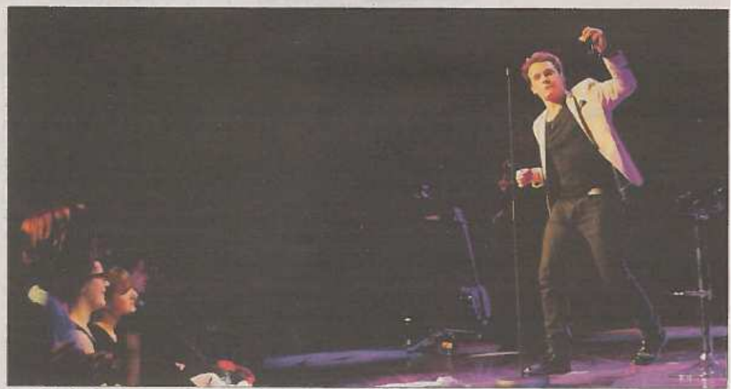
Le 8 février, le chanteur français Bénabar est le premier artiste à fouler les planches de la nouvelle salle de Châteaubernard, le Castel.