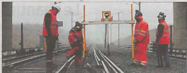
Du côté de Villognon, la pose des rails pour la future ligne à grande vitesse Paris-Bordeaux.