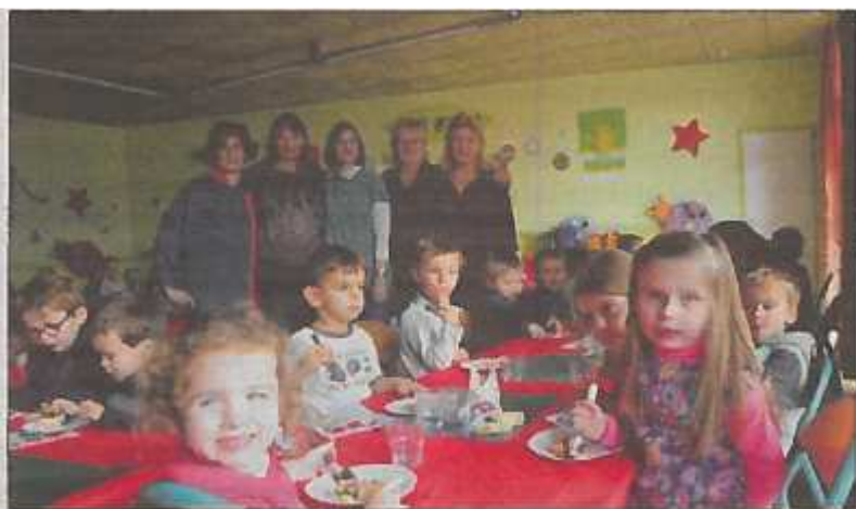
À Châteaubernard, les enfants passent au dessert : une bûche au chocolat.

CHATEAUBERNARD C'était un menu de fête que les petits palais de l'école maternelle Le Petit Prince ont partagé jeudi 17 décembre sous l'œil attentif de leurs encadrants communaux. Et pour ne pas faillir à la tradition, quelques élus sont venus partager le repas avec l'équipe éducative au sein des quatre écoles castelbernardines