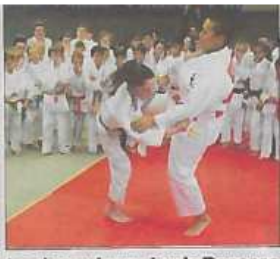
La championne Lucile Decosse à Châteauneuf.