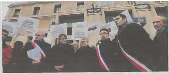
Le 6 février, les élus manifestent devant la gare d'Angoulême pour obtenir une desserte LGV de qualité.