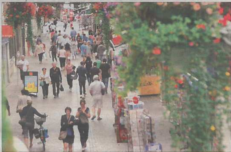
Entre 1975 et 2010, Cognac a perdu 3 670 habitants, soit 16 % de sa population. Entre 2010 et 2013, l'érosion est stoppée.