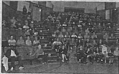
Une centaine de seniors ont participé à cet après-midi qui a mêlé informations de la STGA et divertissement avec le spectacle «La petite vadrouille».

d'information spécifiques les concernant. Puis le public a été conquis par le spectacle La petite vadrouille proposé par la compagnie de la Trace. Rappelons que la manifestation, qui s'inscrit dans la Semaine bleue, semaine nationale des personnes âgées et retraitées, vise à favoriser le bien vieillir et le maintien de l'autonomie des seniors au travers, notamment, de l'utilisation des transports en commun du Grand-Angoulême.