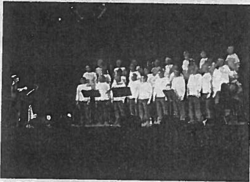
Les Gabeliers d'Artimon étaient les invités d'honneur l'an passé.