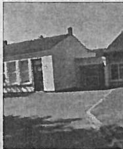
L'école primaire de la commune.

Du débat du Conseil, et malgré les finances de la commune, il ressort une volonté de conserver cette sortie attendue et enrichissante pour les enfants. Ce budget a donc été voté à l'unanimité. Toujours en rapport avec l'école, depuis la ren-