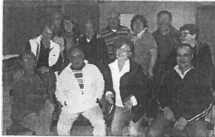
La troupe au complet avec metteur en scène et techniciens.