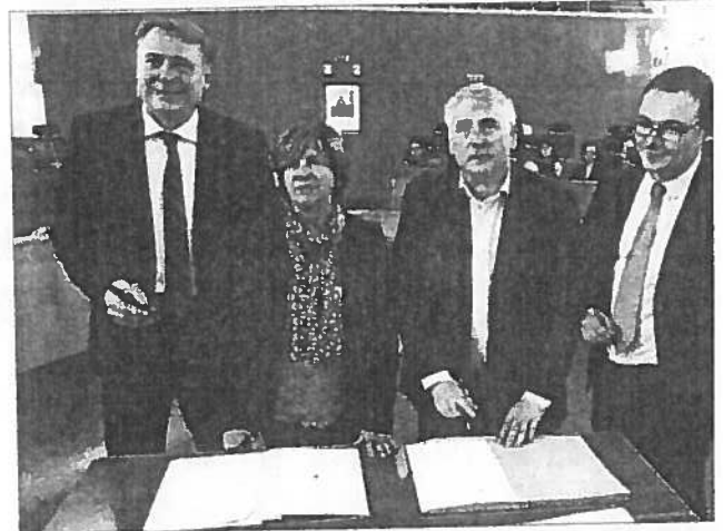
Pôle emploi et le Département ont signé une convention d'accompagnement des demandeurs d'emploi.

Le but? Identifier au mieux les compétences du demandeur d'emploi ainsi que les domaines dans lesquels il aimerait être embauché. Et lever «les freins périphériques» qui le bloquent dans ses démarches. Les freins périphériques? «Il peut s'agir de problèmes de santé, de difficultés pour se déplacer pour les gens