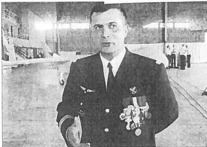
Le colonel Étienne Faury, commandant la BA 709.

Le colonel Étienne Faury soigne ses relations publiques. Ce soir, le commandant de la base aérienne 709 reçoit une délégation d'entrepreneurs locaux et régionaux, à qui il va présenter les missions et le poids économique de son unité. La réception se déroulera autour d'un buffet puis se terminera par la découverte des aéronefs de l'école de pilotage, la démonstration d'un escadron